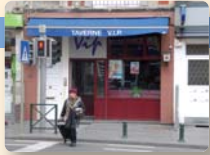
LE VIP 09:00 > 24:00

Chaussée de Louvain 85 Leuvense Steenweg ☎ 0479/99.41.19