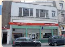
LE GAMBRINUS 08:00 > 04:00

Chaussée de Louvain 107 Leuvense Steenweg ☎ 02/219.62.92