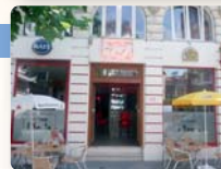
TAVERNE L'ISOLA 10:30 > 24:00

Chaussée de Louvain 163A Leuvense Steenweg