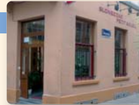
CAFÉ PETIT SOLEIL 09:00 > 24:00

Chaussée de Louvain 107 Leuvense Steenweg ☎ 02/219.62.92