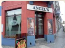
ANGEL'S 07:00 > 04:00

Chaussée de Louvain 197 Leuvense Steenweg