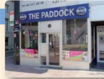
THE PADDOCK QUATRE FRÈRES 10:00 > 04:00

Chaussée de Louvain 85 Leuvense Steenweg ☎ 0479/99.41.19