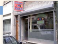
ULUDAG CAFÉ 08:00 > 24:00

Chaussée de Louvain 247 Leuvense Steenweg