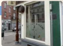
PASSARELA 10:00 > 24:00

Rue de Liedekerke 41 de Liedekerkestraat