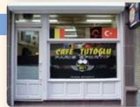
CAFÉ TUTOGLU 07:00 > 23:00

Chaussée de Louvain 197 Leuvense Steenweg