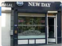
NEW DAY CAFÉ 09:00 > 04:00

Rue de Liedekerke 84 de Liedekerkestraat ☎ 02/219.01.87